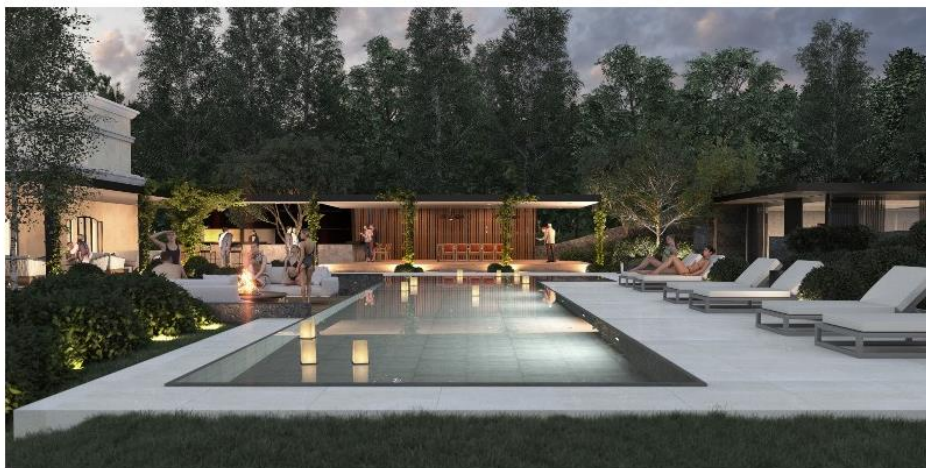
Entre as áreas comuns está a piscina para os hóspedes

As suites serão compostas por sala de estar, terraço, jardim privativo, banheira de grandes dimensões, chuveiro de sensações e lareira externa. Uma das unidades terá ainda uma sauna seca exclusiva. Haverá ainda uma adega com os melhores vinhos argentinos para degustar à disposição dos hóspedes.