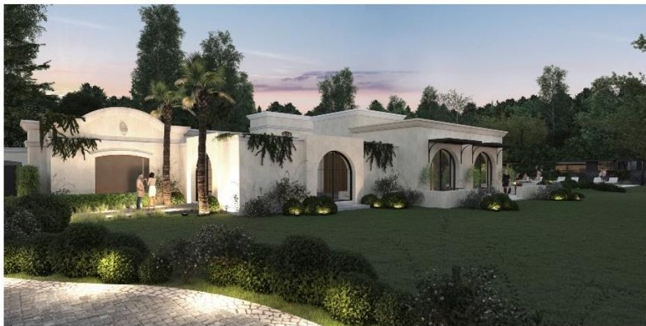
Futura fachada do Susana Balbo Unique Stays

O conceito adotado por Susana Balbo é o de "Be My Guest" ("seja meu convidado"), proporcionando inúmeras atividades e experiências multissensoriais, como uma degustação de vinhos por meio de um serviço personalizado, passeios a cavalo, vela em Potrerillos e ciclismo pelo circuito da vinícola.